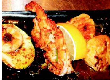
Ebi + Hotategai