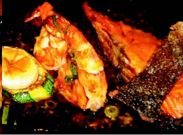
Ebi + Shake