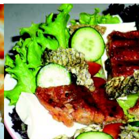
Unagi Tofu Slaatje